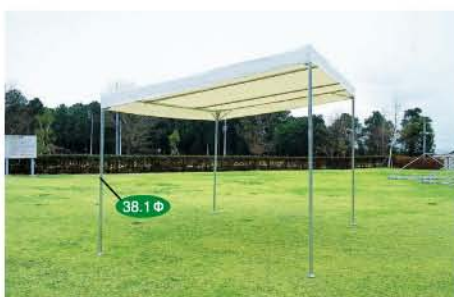
姉妹品 ワンタッチひろびろ空間ハーフテント