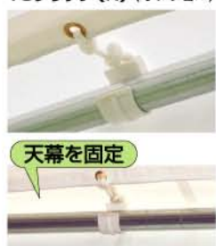
※ワンタッチで固定できます。