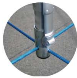
※セーフティストッパーで、テンションパイプとワイヤーをより強かに固定します。