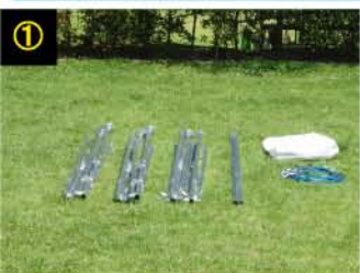
全パーツはワンタッチユニット式です。