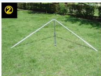
ユニット化(束)の桁パイプのパーツを広げて立てます。