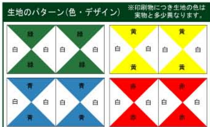
生地のパターン(色・デザイン) ※印刷物につき生地の色は実物と多少異なります。