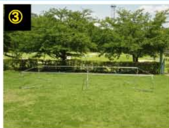
広げたパイプをジョイントし、ワイヤーを取り付けます。