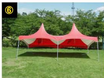
片足ずつ立てます。