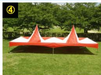
天幕をかぶせ、テンションパイプを天幕の中から突き上げます。